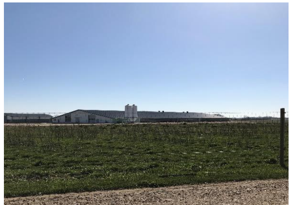
Billede 2. Det nye hønsehus 2. april 2019, Foto Niels Finn Johansen.