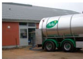
Mejerierne har nu det formelle ansvar for køb og afregning af mælk.