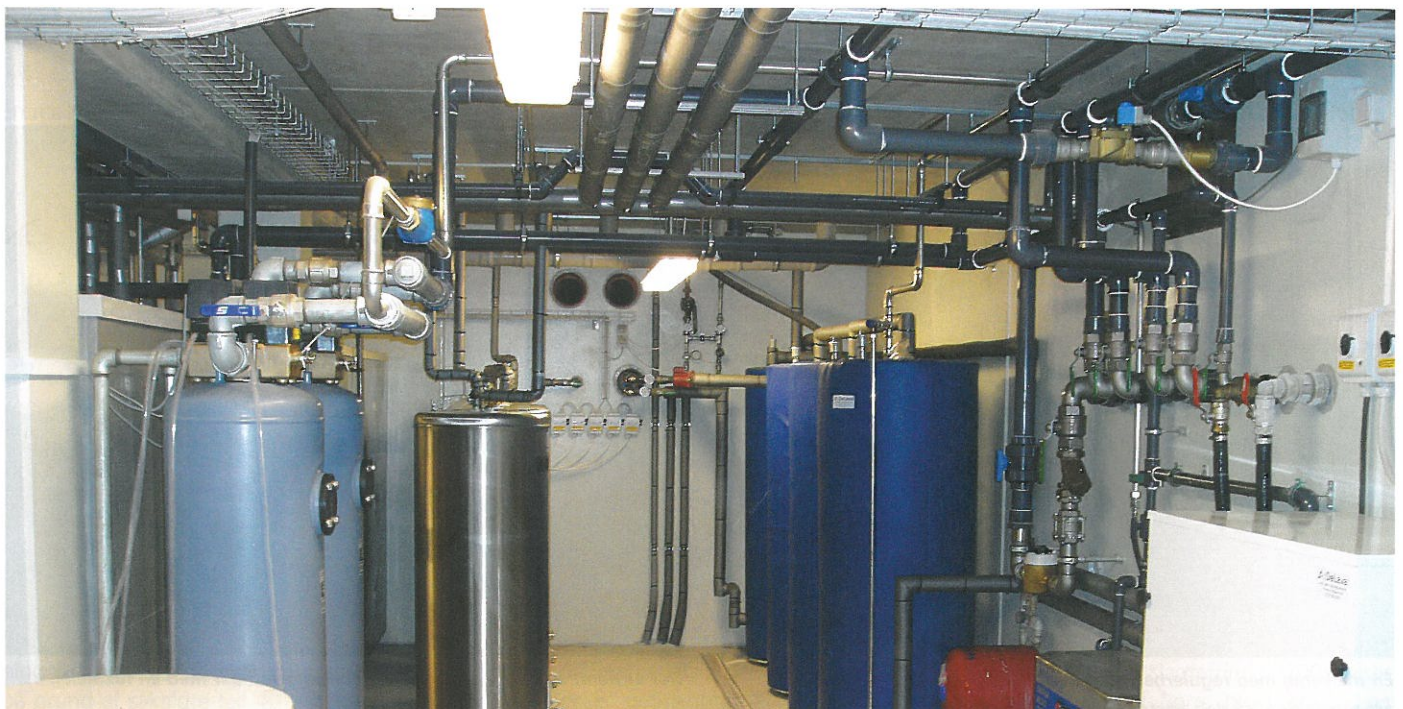
VVS-installation i teknikkælderen under et stort malkecenter.

I malkestalde anvendes sædvanligvis en klud pr. ko. Kludene vaskes typisk i en industrivaskemaskine med direkte udløb uden pumpe.