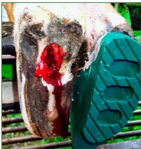
Sølesår efter beskæring, udsikring og pålægning af klovsko. Sålen var undermineret (dobbeltsål) i den bagerste del af kloven, dette kaldes også 'underrun heel'.