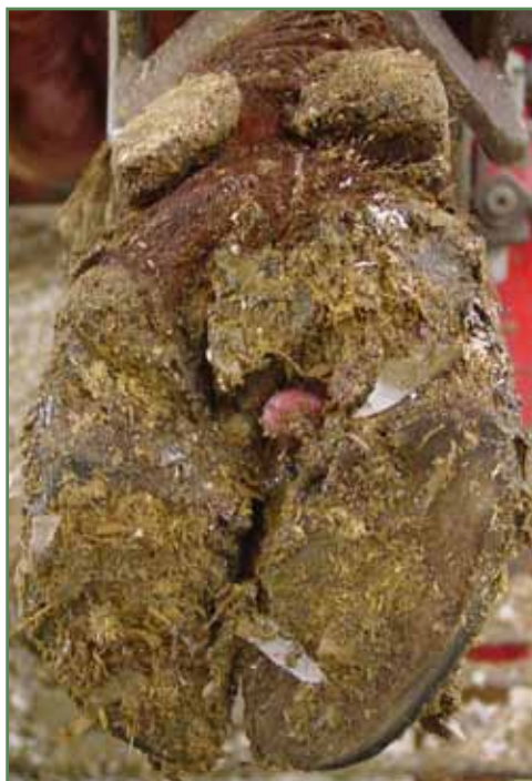
Sølesår med udvækst af arvæv (granulationsvæv) før beskæring.

Optimal klovpleje både med hensyn til underlag og til beskæring. Langsom optrapning til kraftfoder inden kælvning både for kvier og goldkøer. (se laminitis).