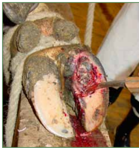
I dette tilfælde er der sølesår med betændelse i klovbenet og der var en lignende skade på det andet bagben, koen måtte aflives. Disse voldsomme tilfælde ses, når sølesåret ikke bliver behandlet i tide.