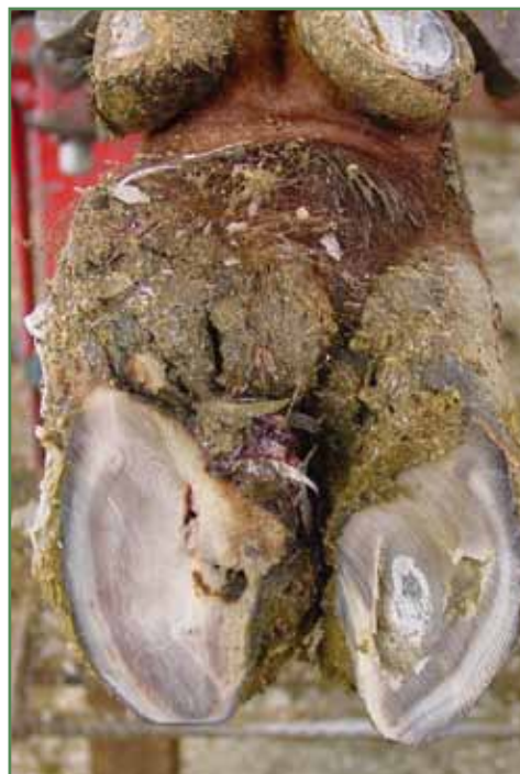
Sølesår med overvækst af sålen på det typiske såleknusningssted. Billedet viser sålen efter den er regelret beskåret, men der endnu ikke er skåret fri omkring sølesåret.