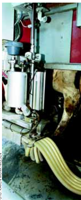
Der står malkerobotter i mange økologiske stalde.

Økologiske mælkeproducenter holder sig ikke tilbage for at gøre brug af den nyeste teknik. Således er malkerobotter i højere grad udbredt i økologiske besætninger end i konventionelle. Og økologerne formår at få økonomisk fordel ud af robotterne. En analyse af 18 økologiske besætninger - ni med robotter og ni uden - viser, at robotbesætningerne opnåede 1.000 kg mælk og 3.000 kr. mere i dækningsbidrag pr. ko end bedrifterne uden AMS.