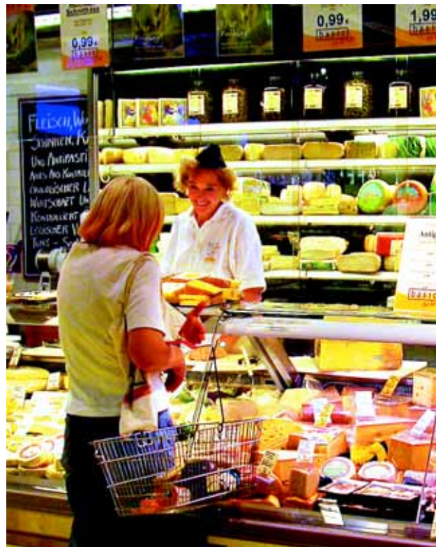
Basic-kæden i Tyskland har i dag flere danske produkter på hylderne, bl.a. fra Thise Mejeri.

Naturmælk har det seneste år øget antallet af andelshavere med otte, men mejeriet har sat en øvre grænse ved 40 andelshavere og en samlet indvejning på 40 mio. kg.