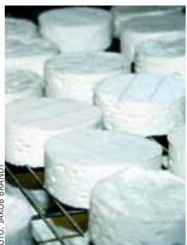
Ost af gede- og fåremælk er en lille niche i kraftig vækst.

Anført af Søvind Mejeri og Løgismose har oste af fåre- og gedemælk udviklet sig til en voksende niche med gode indtjeningsmuligheder. Flere producenter har eget osteri, mens andre vælger at levere mælken til de mindre specialmejerier, som sælger gede- og fåreprodukter i både ind- og udland.