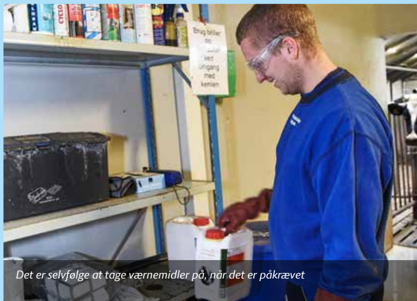
Det er selvfølgelig at tage værnemidler på, når det er påkrævet