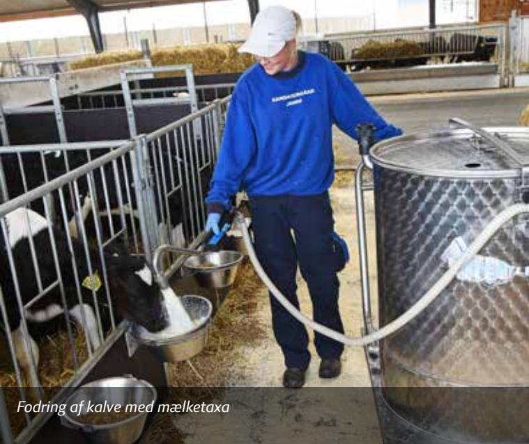
Fodring af kalve med mælketaxa