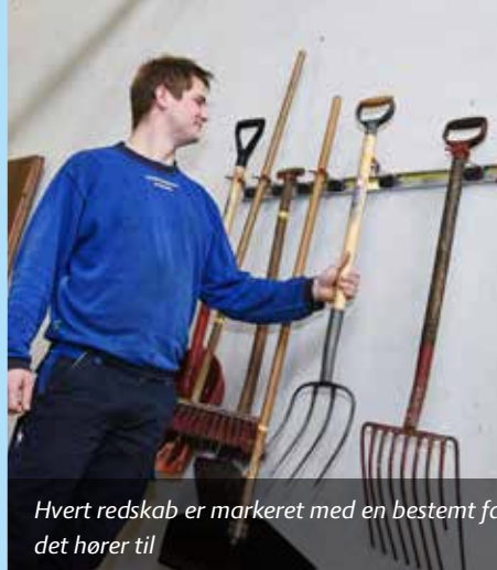
Hvert redskab er markeret med en bestemt farve, der viser, hvor i stalden det hører til