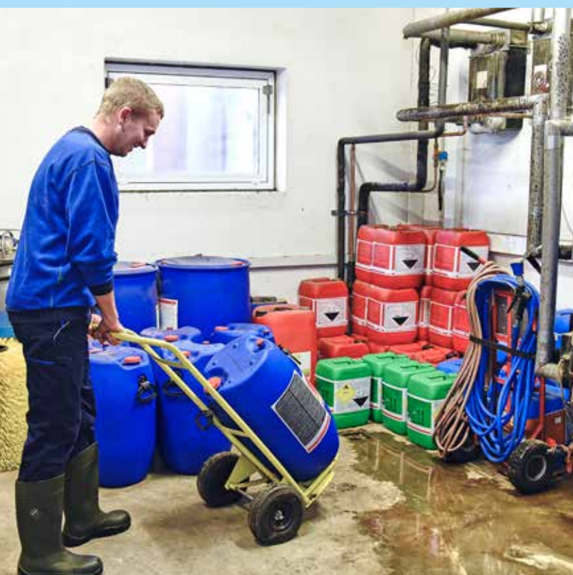
Kemikaliedunke transporteres med sækkevogn