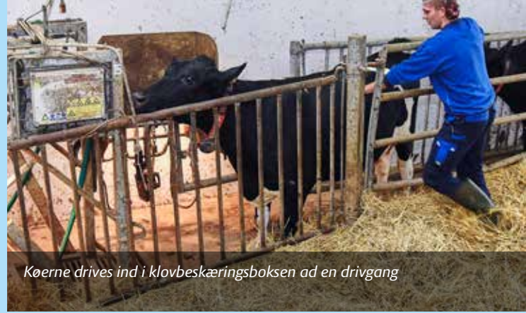
Køerne drives ind i klovbeskæringsboksen ad en drivgang