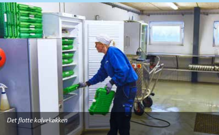
Det flotte kalvekøkken