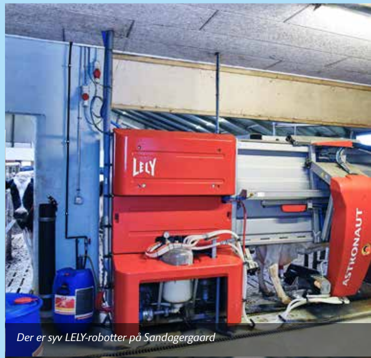
Der er syv LELY-robotter på Sandagergaard