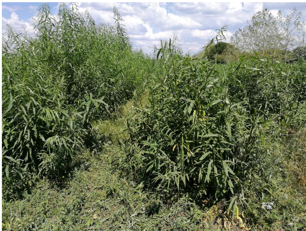
Den 18. juli 2018, pilen til venstre klippet én gang, til højre to gange. Det forventes at jo flere klippinger, jo tættere bliver pilehækken og næringsstofindholdet i de afklippede skud vil stige.

Den eksisterende pilekultur i hønsegården blev høstet i februar 2018, således at nye friske skud kunne vokse frem. Tanken er at klippe pilerækkerne ligesom man klipper en hæk, for herved at øge mængden af helt friske skud, der kan udfodres som grovfoder til hønerne. Med henblik på at beskytte pilekulturen og få pilerækkerne klippet til, har hønerne endnu ikke haft adgang til pilebeplantningen. I 2019 får hønerne adgang til pilekulturen hele året, og der vil dagligt blive klippet et lille stykke af pilerækkerne. Mængden af afklippede pileskud vil blive målt og indholdet af næringsstoffer vil blive analyseret.