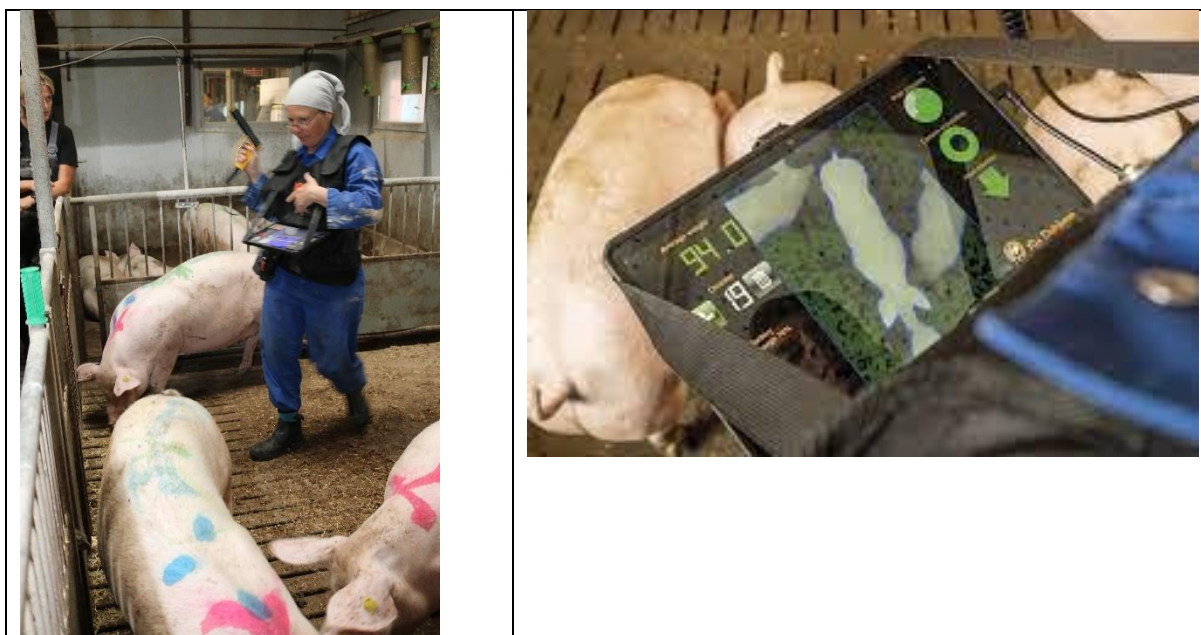
Figur 1. OptiSCAN består af et håndholdt kamera/skanner samt en iPad. Skærbilledet (th) viser med forskellige "symboler" og farveangivelse, om poltens vægt kan bestemmes, ligesom vægten er anført.

Grisenes vægt fastsættes ud fra dens omrids og afstanden til gulvet. Derfor skulle grisen stå med lidt afstand til andre polte og på et jævnt, vandret gulv. Den anvendte software var udviklet til slagtegrise, men findes også til søer. Når skærbilledet af grisen er tilfredsstillende (grønt lys på skærmen), godkendes resultatet og data gemmes (figur 1).