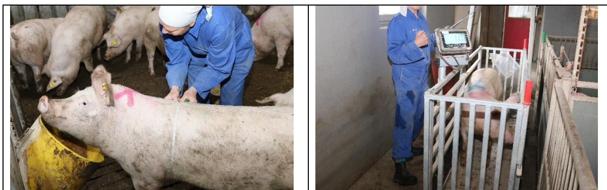
Figur 2. Målebånd

Brovægtene var fra Bjerringbro VÆGTE ( www.bjerringbrovaegte.dk ) og blev kalibreret inden brug. Vægten blev placeret på gangen (figur 3).