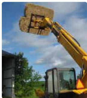
Teleskoplæsser med to rækker spyd i hver sin bigballe.