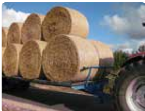
Sikker transport af rundballer med lille rækværk ved enderne.