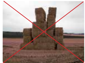
Minibigballe i mark. De øverste kan vælte ned.