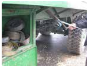
Stropper og opruller lige ved hånden.