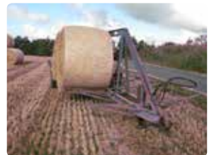
Rundballer hælder mod rækværk i midten.

til øverste halmballe. Dvs. bøjlen skal nå mindst halvt op på halmballen.