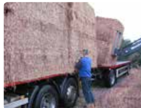
Læsning afsluttes med fastspænding.