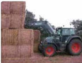
Bigballe i markstak er placeret i forbandt.