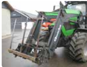
Det nederste spyd er slået op i transportstilling.