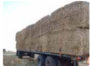
Bigballerne er fastspændt med stropper over alle ballerne.