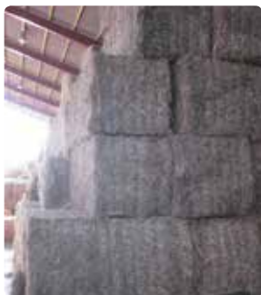
Stabling i forbandt og i trappeformation.