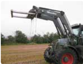
Ved kørsel med halmspyd skal læseren være hævet i øverste stilling.

Under transport skal man sikre sig god synlighed i forhold til medtrafikanter.