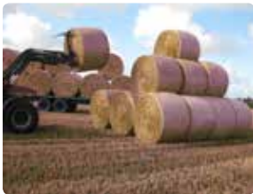
Rundballer stables sikkert på mark.