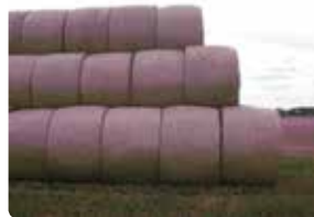
Sikker stabling i forbandt.