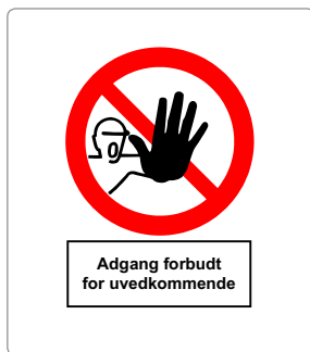
Skilte kan markere, at der er adgang forbudt for uvedkommende til halmageret.