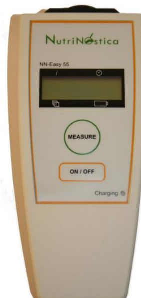
Billede 1: NutriNostica ApS

Mangantesteren NN-Easy 55 er et simpelt diagnostisk værktøj til afklaring af, hvorvidt planten lider af manganmangel. Apparatet foretager en fluorescens-måling direkte på bladet, som udtrykkes ved en PEU-værdi (Plant Efficiency Unit). PEU-værdien angiver plantens fotosynteseaktivitet, som bl.a. påvirkes af manganmangel, med værdier fra 1-100. En PEU-værdi på 100 indikerer en sund plante. Da målingen kan udføres direkte på bladet, kan testen foretages uden afgrødeskade.