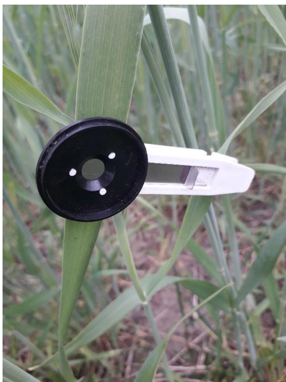
Billede 4: Clipsen sættes på plantens seneste fuldt udviklede blad (Husk at clipsen skal være lukket for at mørkeadaptere bladet).