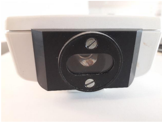
Billede 2: Målingen foretages med fluorescensdetektoren, som sidder i toppen af måleapparatet.