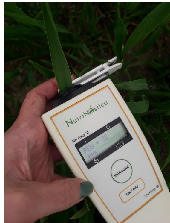
Billede 5: Efter 20 min. mørkeadaptering måles PEU-værdien ved at holde clipsen mod fluorescensdetektoren, åbne clipsen og trykke på 'Measure'-knappen.