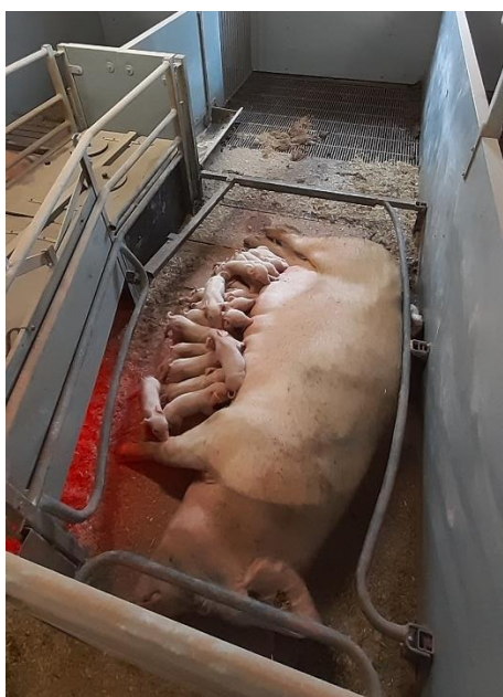
Figur 2: Foto af faresti til løse søer med fare-ring og uden gulvbøjle (Wellfair-pen).