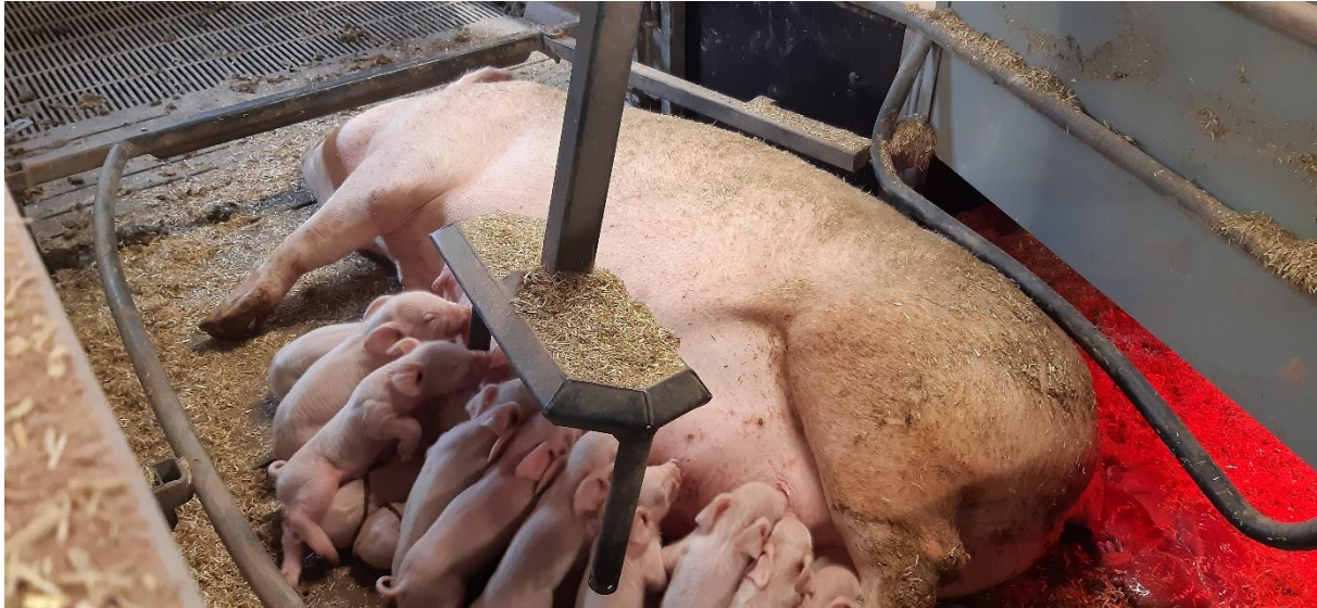
Figur 1: Foto af faresti til løse søer med fare-ring og pendul (Wellfair-pen).

En dansk griseproducent har over en længere årrække arbejdet med indretningstiltag, som kan øge pattegriseoverlevelsen i farestier til løse søer. Tidligere har stier fra samme producent indgået i en SEGES-test, i 'Test af ti stityper til løse diegivende søer' [6], hvor stien (Wellfair-pen) med fare-ring og pendul indgik (se Figur 1).