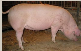
Kraftige og lige ben