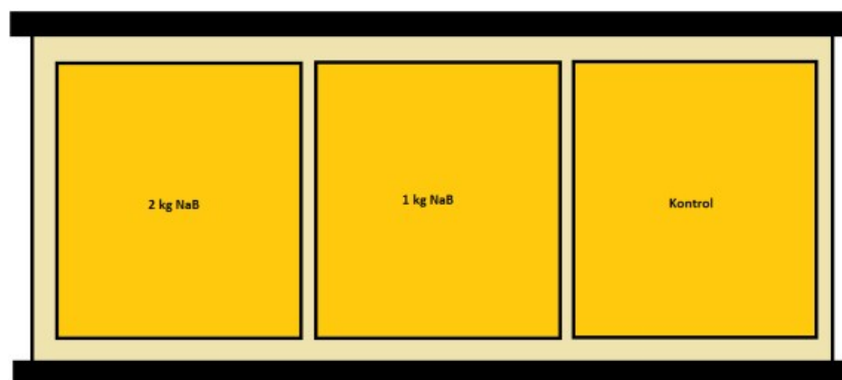
Figur 1. Inddeling af felter på plansiloen. Behandlingerne blev fordelt tilfældigt på hver stak.

Efter ca. 30 dages ensilering blev der udtaget prøver fra hvert felt i alle siloer. I hvert behandlingsfelt blev der udtaget to prøver med hænderne ned til 25 cm's dybde. Alle prøver blev efter udtagning lagt på køl og derfra transporteret til Kvægbrugets ForsøgsLaboratorium (KFL) i Skejby, Aarhus.