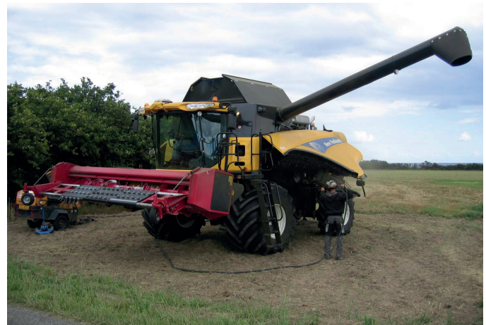
Hovedrengøring vil omfatte rengøring med trykluft og tømning af stenfælden mellem indføringen og tæskecylinderen på mejetærskeren og ballekammeret på halmpresseren.

Det er dog en dårlig idé - som her - at gøre det ude i marken, hvor for eksempel græsfø nemt spredes til markerne.