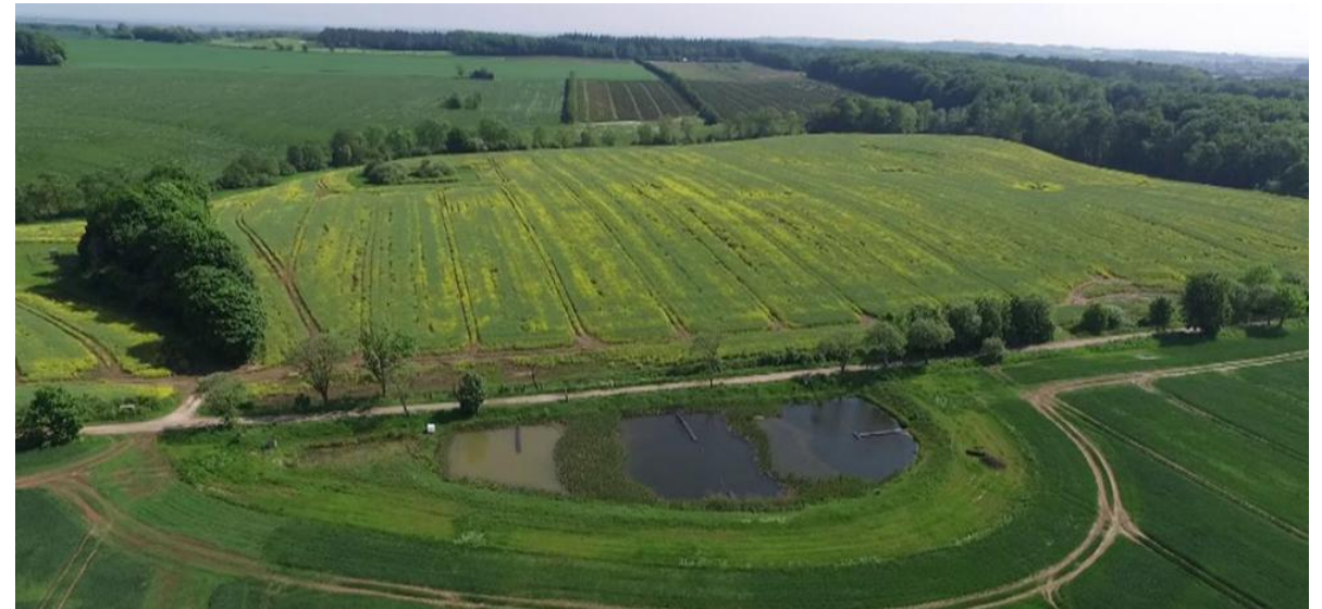
Åbent minivådområde.