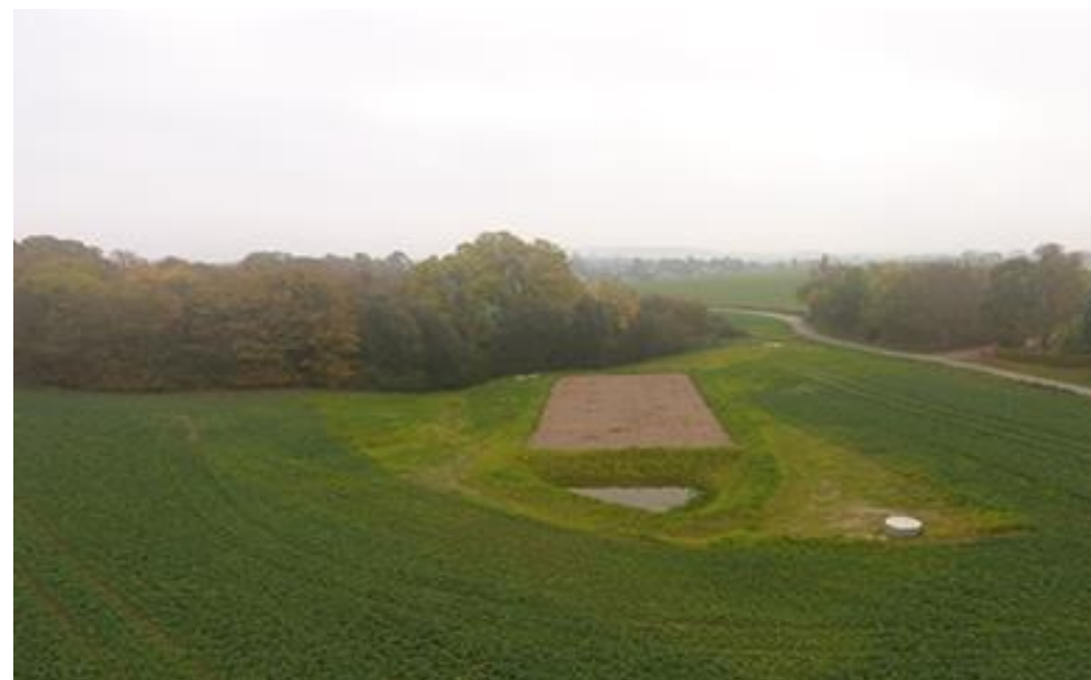
Minivådområde med filtermatrice.