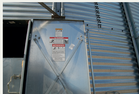
Sluk altid strømmen på hovedafbryderen, før du går ind i siloen.

EN GASTÆT SILO skulle tømmes og gøres ren, så derfor kravlede en medarbejder med skovl og kost ind for at få det sidste korn hen til tømme-sneglen midt i tanken. For at lette arbejdet lod han både denne snegl og den vandrette snegl, der fører kornet ind mod midten, være tændt. Uheldigvis gled medarbejderen i kornet og faldt, så den vandrette snegl fangede hans bukseben og trak foden ind i sneglen. Til alt held stoppede motoren ved den større belastning. Medarbejderen råbte op, og kolleger skar ham fri med en vinkelsliber. Foden blev reddet på operationsbordet – men kun takket være en svag motor.