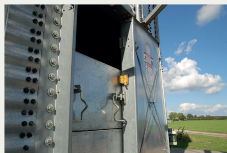
Afbryd ikke sikkerhedskontakten i lugen.

Manden blev fundet i siloen, men hans liv stod ikke til at redde, og en læge på stedet erklærede ham død. Vidner har fortalt, at han stod på siloen, men pludselig var forsvundet. Brandvæsenet havde 25 mand på opgaven med at tømme siloen for de flere hundrede ton korn. To korn-sugere fra et foderstoffirma sugede korn ud af siloen, mens 10 mand gravede i kornet.