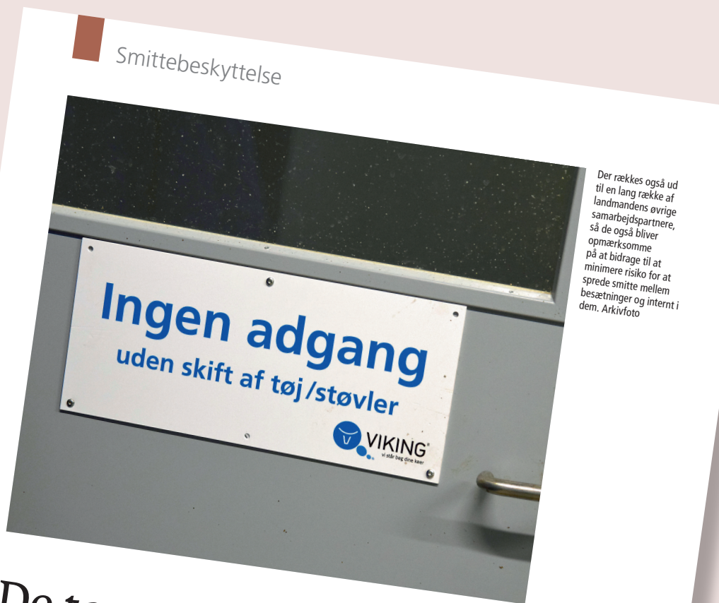
Der rækkes også ud til en lang række af landmandens øvrige samarbejdspartnere, så de også bliver opmærksomme på at bidrage til at minimere risiko for at sprede smitte mellem besætninger og internt i dem.