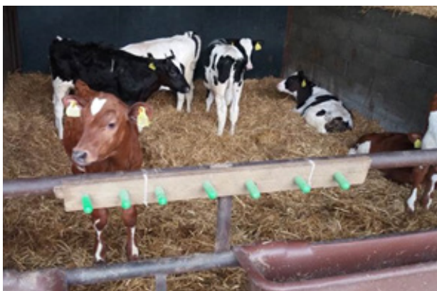
FIGUR 3 Sutter i træplade, ophængt med strips. Som vist på billedet, kan suttebaren vendes ud af boksen, når den ikke er i brug.