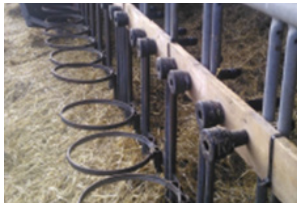
FIGUR 4 Pattegummi i træplade. En løsning der gør det nemt at udskifte og vaske sutter.