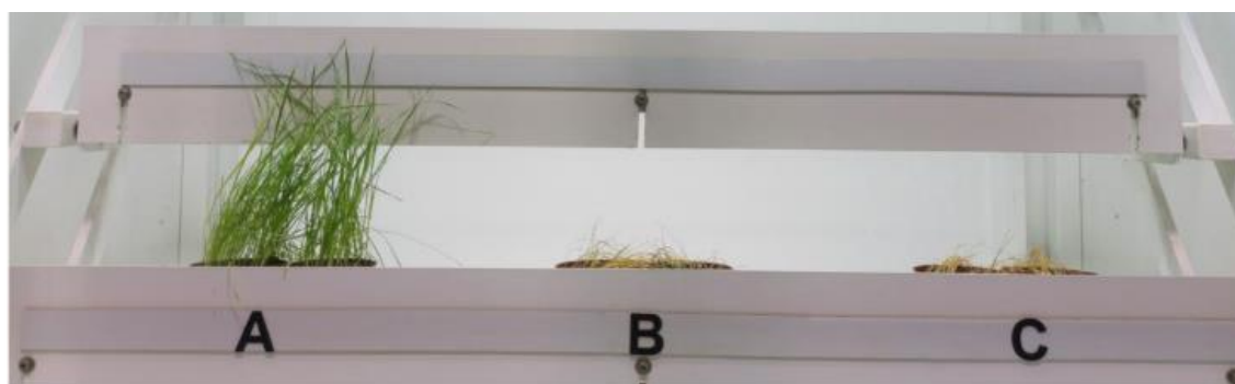
Figur 1. Resultat af resistenstest af agerrævehale med 360 og 720 gram glyphosat pr. ha i glyphosatproduktet Roundup Future, som indeholder 500 gram glyphosat pr. liter.