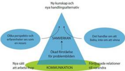
Figur 3. Framstegstriangeln, som illustrerar att förändrade arbetsformer och relationer mellan aktörer bidrar till ett lärande som är själva fundamentet i samverkansprocesser.

The progress triangle in collaboration or multi-stakeholder partnerships illustrates the importance of new ways of working together and to develop our relations in order to successfully reach common goals