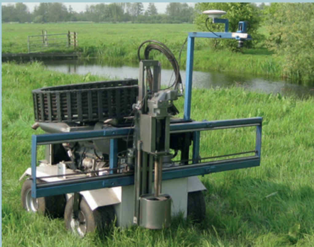
Udviklingen i teknikken til at fjerne skræpper.