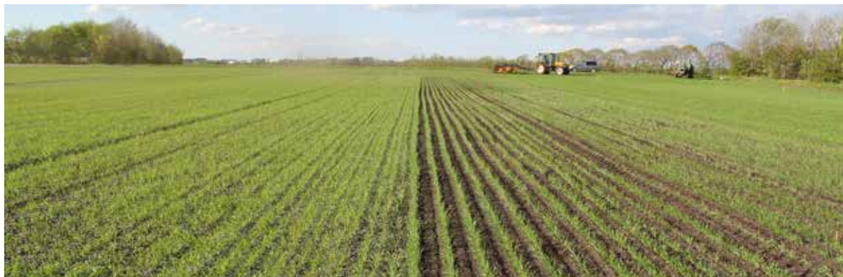
Forsøg med radrensning i vårhvede. Til venstre ubehandlet på 12,5 cm rækkeafstand og til højre radrenset på 25 cm rækkeafstand.

Mekanisk bekæmpelse af ukrudt har de seneste år været i fremdrift, godt hjulpet på vej af kamerastyrede radrensere, og kapaciteten og effektiviteten er dermed vokset. Der er i 2014 og 2015 lavet radrensningsforsøg i vårsæd. I forsøgene er forskellige strategier af traditionelle metoder med blindharvning og ukrudtsharvning sammenlignet