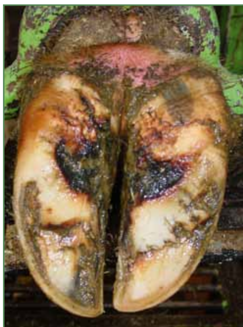
Balleforrådnelse i let, overfladisk grad med små ætsninger og sprækker. Bemærk den røde, irriterede hud oven for ballen.

Når huden er ødelagt og har mistet modstandskraft over for bakterieangreb, vil bakterier som forårsager andre klovlidelser kunne forværre tilstanden drastisk. Bacterioides nodosus som isoleres fra tilfælde af klovspaltebetændelse, kan skade de dybere liggende væv yderligere, og