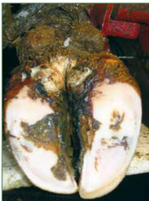
Balleforrådnelse i svær grad med dybe ætsninger og blottet læderhud.

For at undgå, at balleråd bliver et besætningsproblem, er det vigtigt at holde gulvarealer så rene og tørre som muligt. Derved forebygges både digital dermatitis og balleråd. Fodbade kan bruges i besætninger med komplicerede tilfælde, men det kan ikke stå alene.