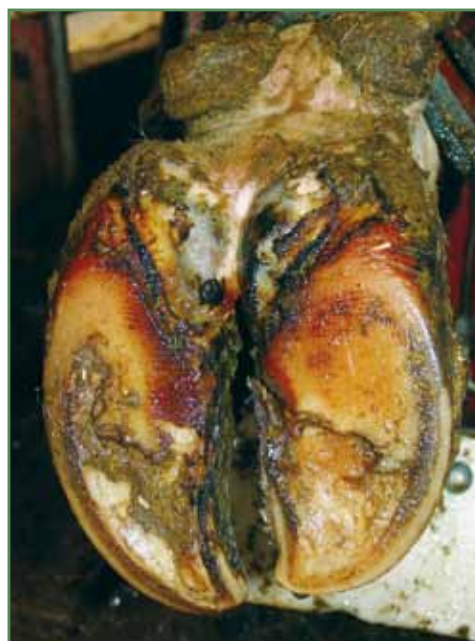
Balleforrådnelse i middelsvår grad med dybe ætsninger og revner, som delvis når læderhuden.