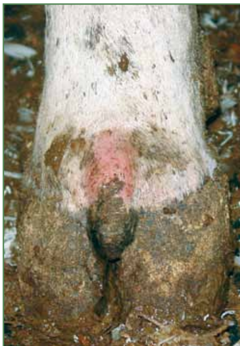
Nydannelse i klovspalten set forfra.

En anden årsag kan være klovspaltebetændelse, eller følgevirkning af klovbrandbyld. Ved fejlagtig klovbeskæring, hvor der er skåret 'spredklov', kan køerne på meget kort tid danne en nydannelse på grund af en voldsom belastning af hud og