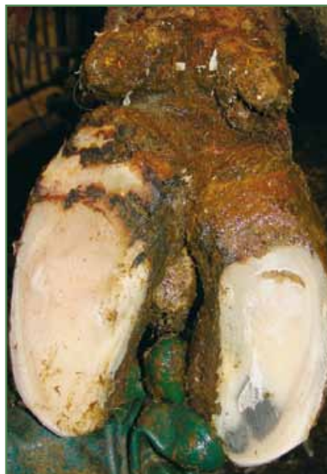
Nydannelse med digital dermatitis. Koen var meget halt.