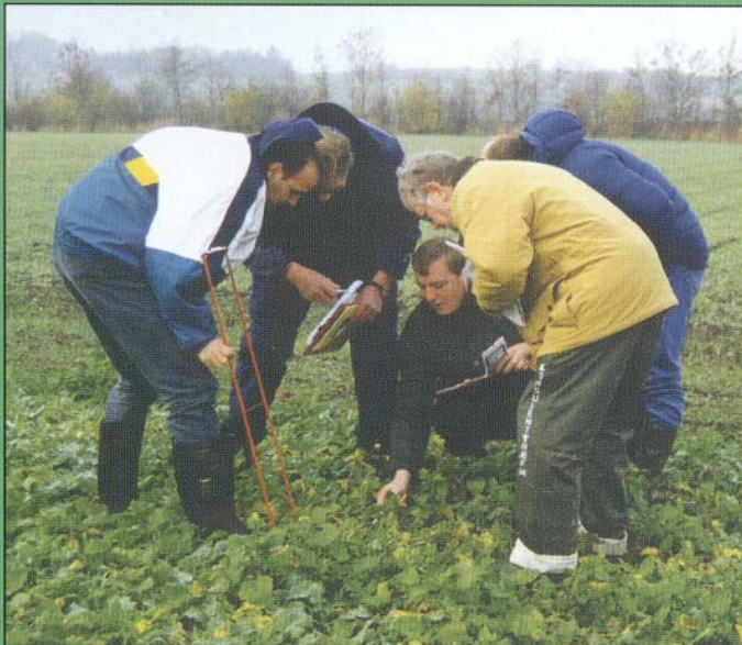
Efteruddannelse er med til at sikre en høj kvalitet i forsøgsarbejdet.