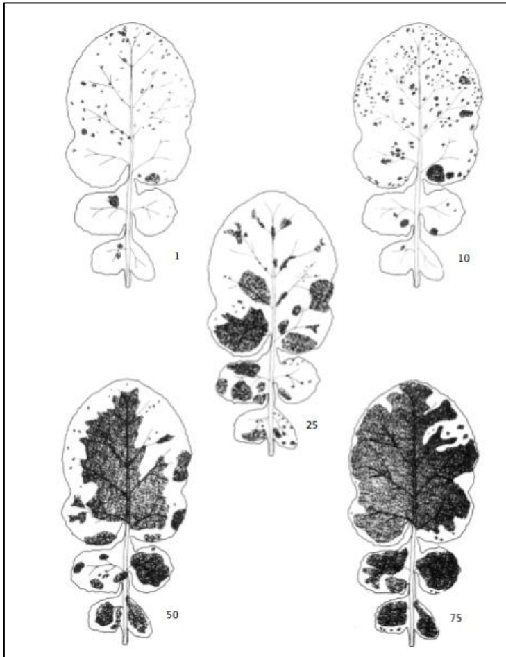
Billede 3. Bedømmelse af procent dækning af lys bladplet på blade.