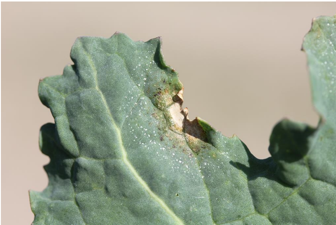
Billede 2. Nærbillede af en af pletterne på billede 1. Bemærk de små hvide "snebolde", som er tydeligst under fugtige forhold.