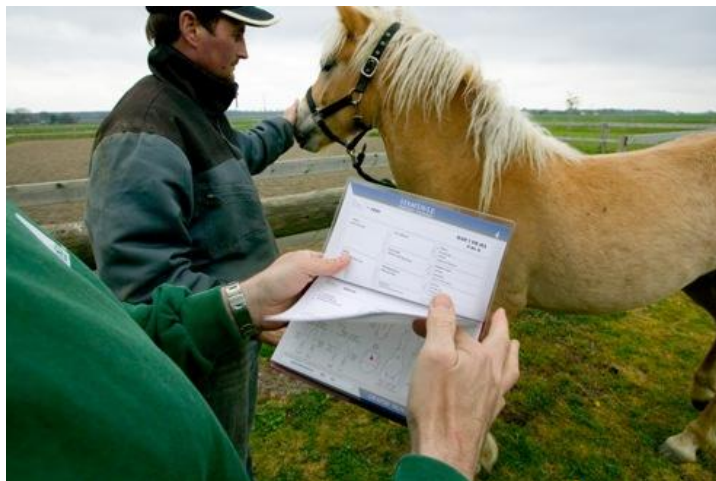
Vær sikker på at pas, ejercertifikat og hest passer sammen

Overvejer man at sælge en hest på kredit, anbefales det at søge professionel rådgivning for at undersøge hvilke muligheder, der er i den konkrete situation.