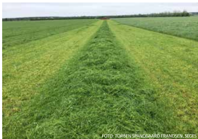
BILLEDE 4 Her udlægges kløvergræsset i maskinens arbejdsbredde.