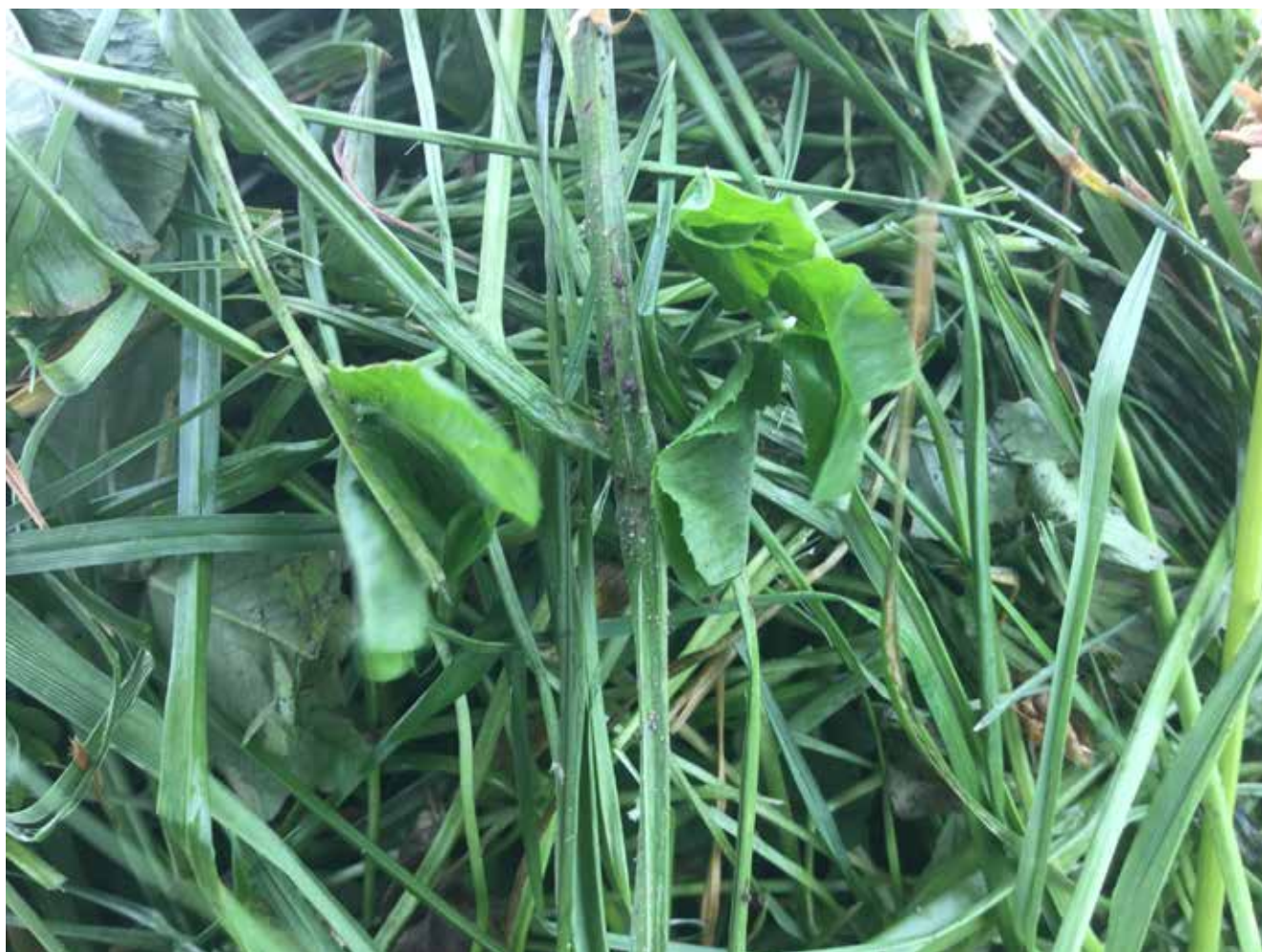
BILLEDE 21 Her ses jord påført afgrøden under sammenrivning.

Det kunne visuelt ses, at de mere avancerede river præsterede en bedre styring, når riven skulle sænkes ved igangsætning fra forageren. Hvis sænkningen alene kontrolleres af maskinføreren, bliver resultatet helt afhængig af ham. Også efter 12 timer på arbejde.