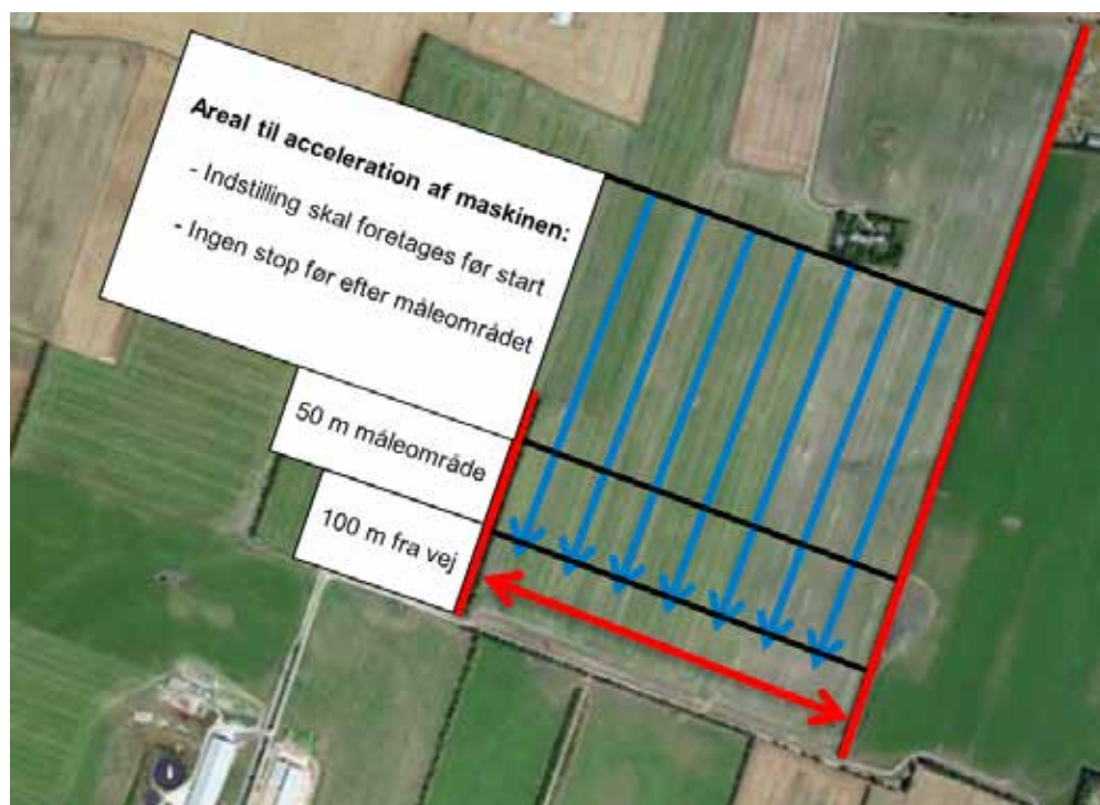
FIGUR 1 Principskitse over fremgangsmåden ved sammenrivning (her marken ved første slæt)