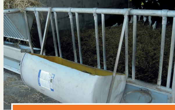
En stor krybbe til kalvene kan godt være hjemmelavet.

Robert Pedersen slog også et slag for store krybber til kalvene.