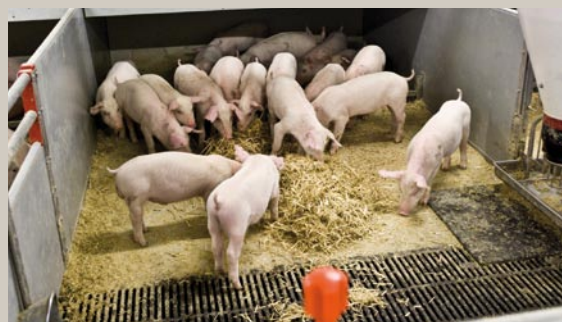
Солома распределена на сплошном полу.