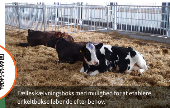
Fælles kælvningsboks med mulighed for at etablere enkeltbokse løbende efter behov.

I bogen 'Indretning af stalde til kvæg – Danske anbefalinger' kan du læse mere om emnet i to nyreviderede kapitler om